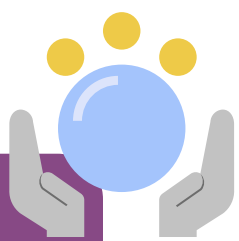
Imagen de la tecnología

El prototipo fue implementado en una comunidad de artesanos de muebles rústicos con resultados positivos en el tratamiento de la madera previo a ser trabajada. La invención puede apoyar los procesos productivos de comunidades rurales, pequeños aserraderos y empresas que trabajen con maderas de pequeñas dimensiones y grosor, donde adicionalmente se pueda aprovechar el aserrín de desperdicio y su compactación para generar biomasa, como combustible auxiliar para la operación del secador de madera.